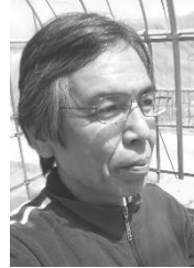
仕事の後の一杯は 実に、うまいもんだ